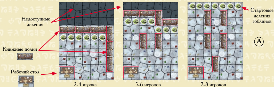
Схема А показывает готовую к игре Библиотеку с рабочим столом и книжными полками. Независимо от числа игроков, ставьте Ригора Мортиса на одно и то же деление (см. схему Б).